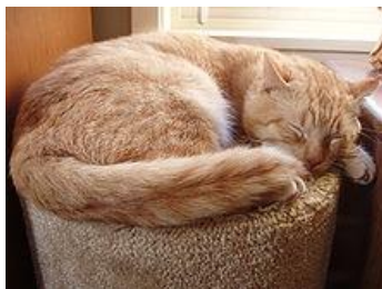
Mačky prespia väčšinu dňa

Popísať povahu mačky nie je ľahké. Existujú mačky temperamentné, flegmatické, cholerické, odvážne aj bojazlivé, náladové aj priateľské. Mačka však nie je samotárske zviera a potrebuje nadväzovať sociálne kontakty so svojim okolím. Aj medzi mačkami existujú samotárske jedince, mačka je však spoločenské zviera, čo je už dávno dokázané. U voľne žijúcich mačiek existuje zložitá sociálna štruktúra a prebiehajú rôznorodé sociálne interakcie.